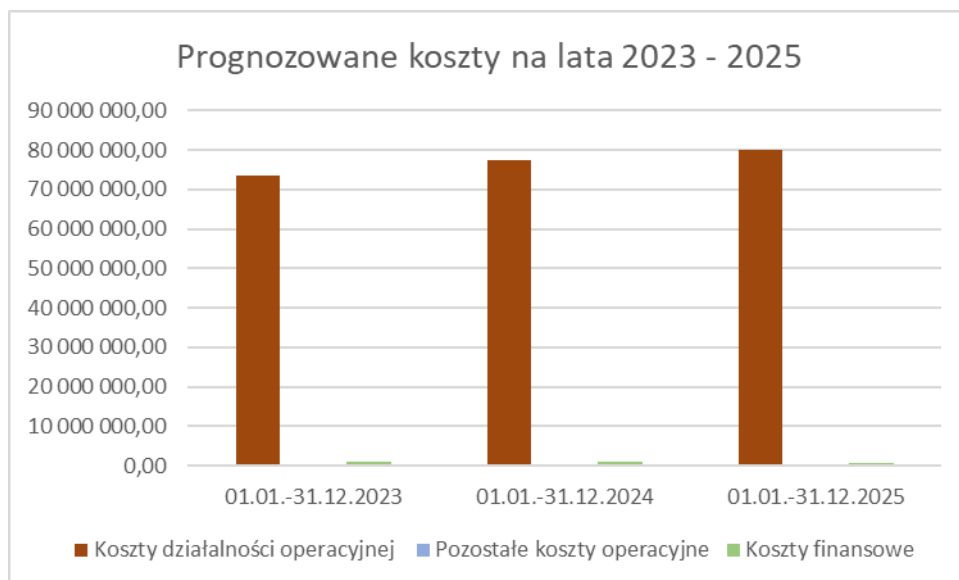
Wykres nr 2

Analogicznie do wykresu nr 1, w prognozowanych kosztach najwyższą wartość stanowią koszty działalności operacyjnej tj. związanej bezpośrednio ze świadczonymi usługami.