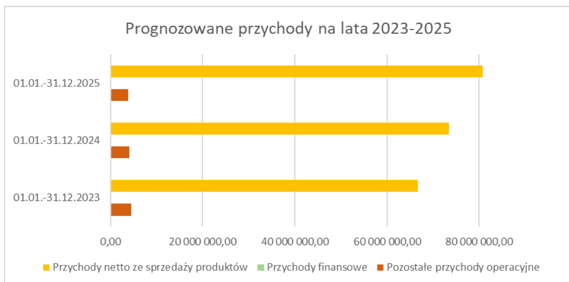
Wykres nr 1

Z powyższego wykresu widać wyraźnie, iż największą wartość w przychodach stanowią Przychody netto ze sprzedaży, w których istotną kwotę stanowią przychody z Narodowego Funduszu Zdrowia za wykonywanie świadczenia zdrowotne.